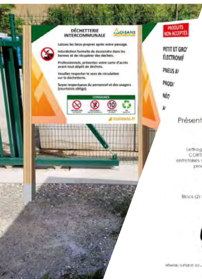
Présentation des vues perspective, face, profil et dos.